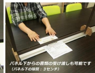
パネル下からの書類の受け渡しも可能です (パネル下の隙間: 3センチ)